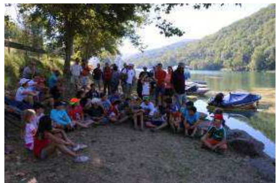
En attente du signal de départ pour la pêche en binôme

Ce stage s'est clôturé par le traditionnel concours de pêche en binôme (un enfant/un adulte) et par le repas qui a réuni une centaine de personnes à la Maison du temps Libre.