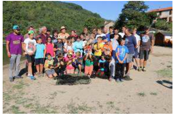
Au matin de la nuit carpe

Le deuxième stage, d'une durée d'une semaine, a lieu fin août. C'est un stage multipêches (carnassiers, carpes de nuit, poissons blancs) sur les lacs de Pinet, La Jourdanie et Pareloup.