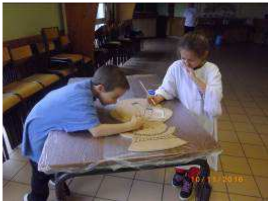
Peinture d'un bonhomme de neige

En ce qui concerne les activités périscolaires dirigées, la première période de l'année, allant de la rentrée de septembre aux vacances de la Toussaint a été tournée vers la pratique des langues : anglais et occitan. La deuxième période, allant des vacances de la Toussaint aux vacances de Noël a été consacrée à l'atelier des « lutins du Père Noël ». Pendant 6 semaines, les enfants ont peint, découpé, décoré, fabriqué toutes sortes de décorations qu'ils ont installées dans le village jeudi 15 décembre, avec l'aide de nombreux adultes, pour le plaisir de tous.