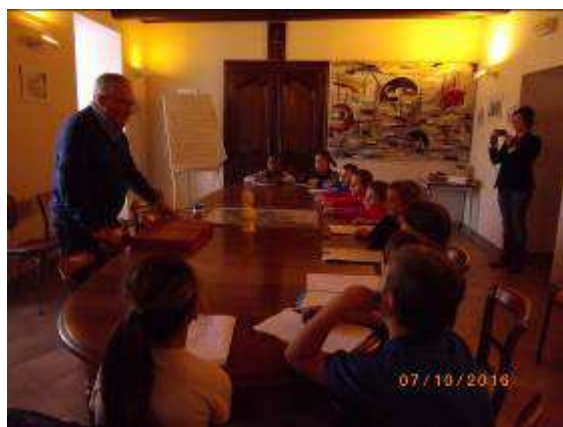
Dans la salle du Conseil Municipal

Dans le cadre de l'enseignement moral et civique, les élèves de la classe des grands se sont rendus à la mairie réaliser un petit reportage et rencontrer Monsieur le Maire. Après les questions relatives à la fonction du maire et de la mairie, A quoi sert une mairie ? Quels sont les problèmes les plus durs à gérer ? Combien célébrez-vous de mariages par an ? sont arrivées des questions beaucoup plus personnelles : Peut-on être maire quand on est à la retraite ? ou bien Que faites-vous en dehors d'être maire ? ou encore Est-ce que c'est bien d'être maire ?