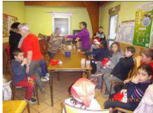
Après la décoration du village, on se retrouve autour d'un bon chocolat chaud...