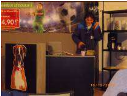
Quand la M.T.L. se transforme en garage!

malheureusement pas grand-chose aux voitures. Ce fut une soirée détente comme nous le propose toujours la joyeuse troupe des Fadareilles.