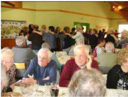
Bonne ambiance au repas