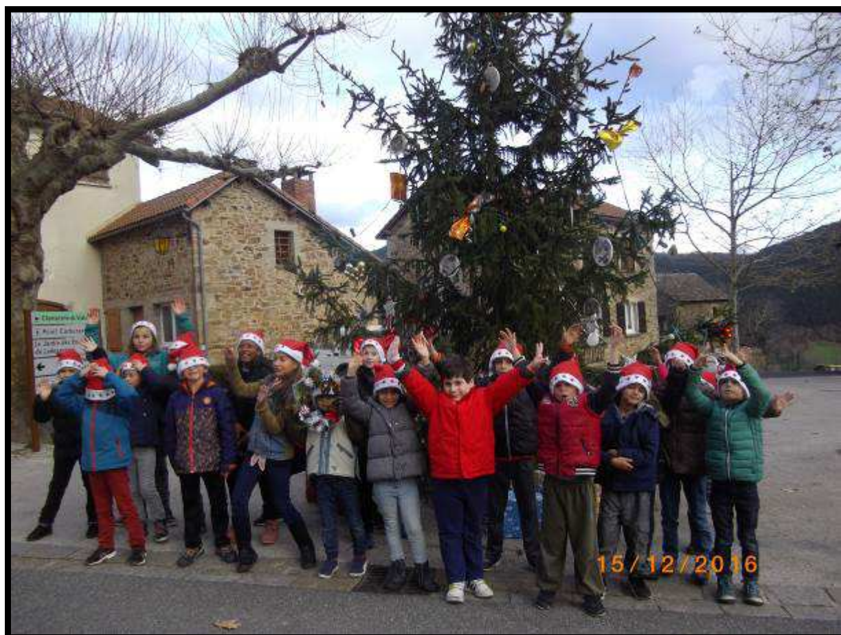
Les espiègles lutins du Père Noël font une halte sous le sapin du village.

Responsable de publication : Jean-Claude NIEL