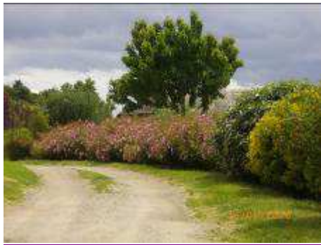
Haie de roses à Axès

Suite à notre participation au concours « communes fleuries » avec visite du jury au cours du mois de juillet, notre commune s'est vue attribuer un « prix d'encouragement ». C'est bien mais on doit sûrement pouvoir faire mieux ! La campagne est proche, faisons-la entrer dans le village ! Nous faisons appel à vous. Vous avez sans doute dans vos jardins des plantes qui s'y plaisent particulièrement bien et qui pourraient être bouturées. N'hésitez pas à investir une plate-bande municipale et à mettre en place vos plants -hors période de gel évidemment-. Vous pouvez aussi nous les transmettre en mairie ou à la bibliothèque et nous nous chargerons de la plantation. D'autre part, si vous possédez de vieux seaux, arrosoirs ou autres objets en métal ou en bois, merci de nous les transmettre. Customisés, ils pourraient retrouver une nouvelle vie et devenir des éléments de décoration originaux de notre village. La décoration du village, l'amélioration du cadre de vie doit devenir l'affaire de tous où chacun peut apporter sa modeste contribution.