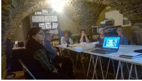
Les bénévoles au travail