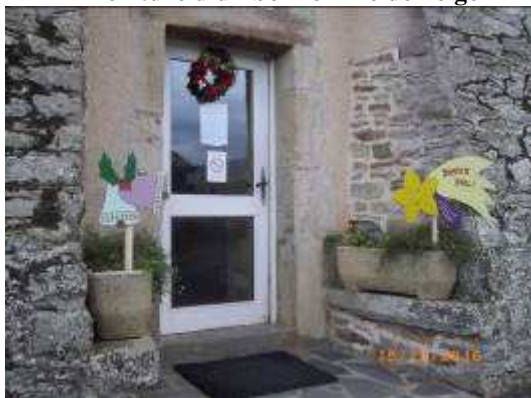
Et voilà le résultat à la porte arrière de la mairie!