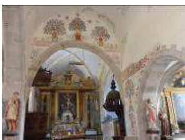
Les peintures fleuries retrouvent vie.

En 2016 nous avons poursuivi notre action au travers de la restauration par Mme Biron (artisan restauratrice peintre en décor) des retombées latérales du triple bouquet de l'arc triomphal de l'Eglise de St Symphorien. Le soin et la qualité de cette restauration ont répondu à nos attentes et viennent bien compléter le travail réalisé pour le triple bouquet de l'arc triomphal.