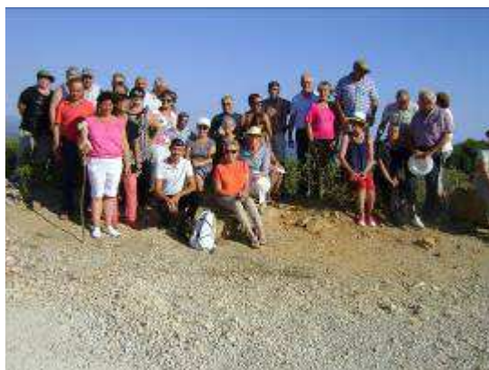
Le voyage sous le beau soleil de Marseille