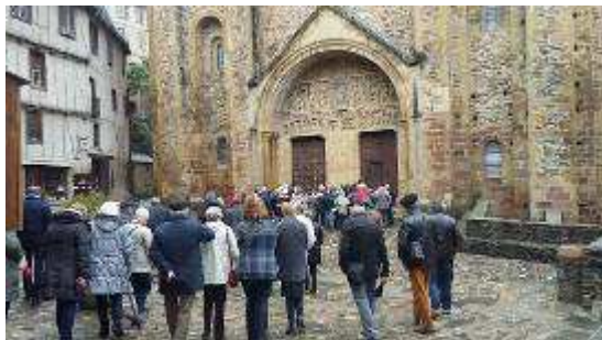
Les membres en admiration devant le célèbre tympan de l'église de Couques

Outre ces manifestations qui nous ont permis d'acquérir des financements, l'Association a proposé à ses adhérents (qui ont financé leur journée) une sortie le 14 octobre à CONQUES : 30 adhérents se sont retrouvés à Conques pour une visite de l'abbatiale, de son tympan et du Trésor ainsi que des tribunes, des chapiteaux romans et des vitraux de Soulages. Une belle journée – pluvieuse certes – mais pleine d'amitié autour de notre patrimoine.